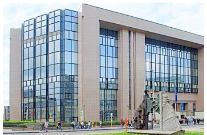
Das Justus-Lipsius-Gebäude in Brüssel, besser bekannt als der Sitz des Ministerrates der Europäischen Union.

Stärkung des Außenhandels: Das "Achtzehnmonatsprogramm" zielt auf die Sicherung und Ausweitung des Europäischen Raums der Sicherheit und Stabilität, die Fortentwicklung der Europäischen Nachbarschaftspolitik und die Stärkung der transatlantischen Beziehungen sowie den Ausbau strategischer Partnerschaften ab.