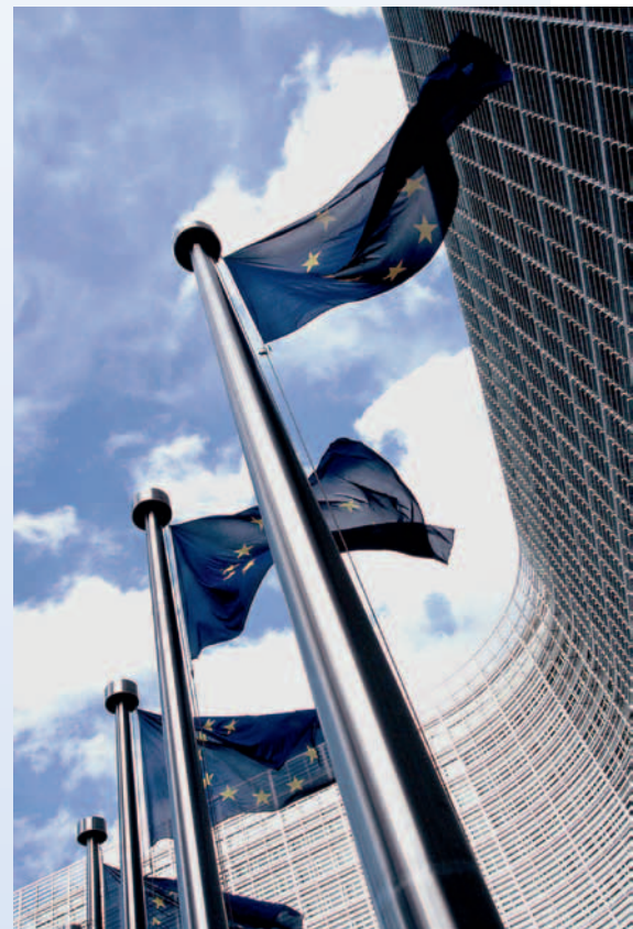
European flag outside the Commission

Denn Fakt ist: Das europäische Verfahren für geringfügige Forderungen wird die Zahl der ohne sachlichen Grund säumigen Schuldner bei grenzüberschreitenden Geschäftsbeziehungen sicherlich reduzieren. Es ist zu wünschen, dass dies die Rechtssicherheit im Binnenmarkt und damit die Bereitschaft zum Abschluss grenzüberschrei-